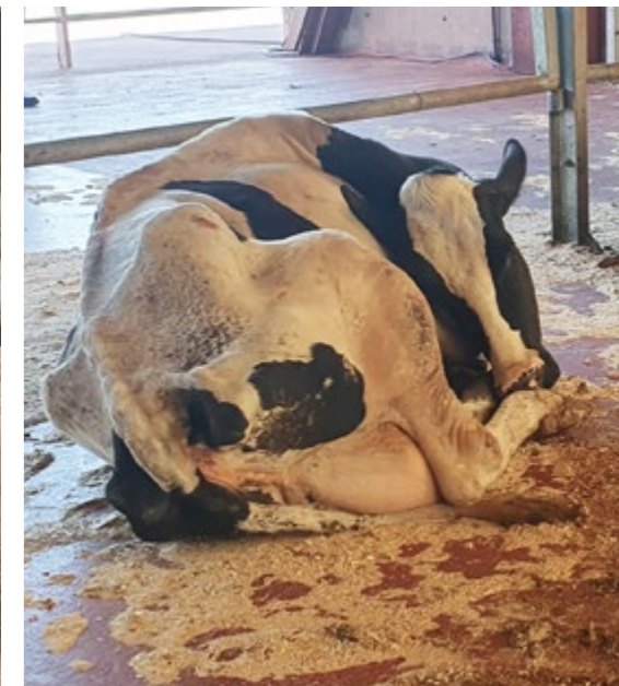
Emma ist stark lahm und leidet offensichtlich unter Schmerzen.