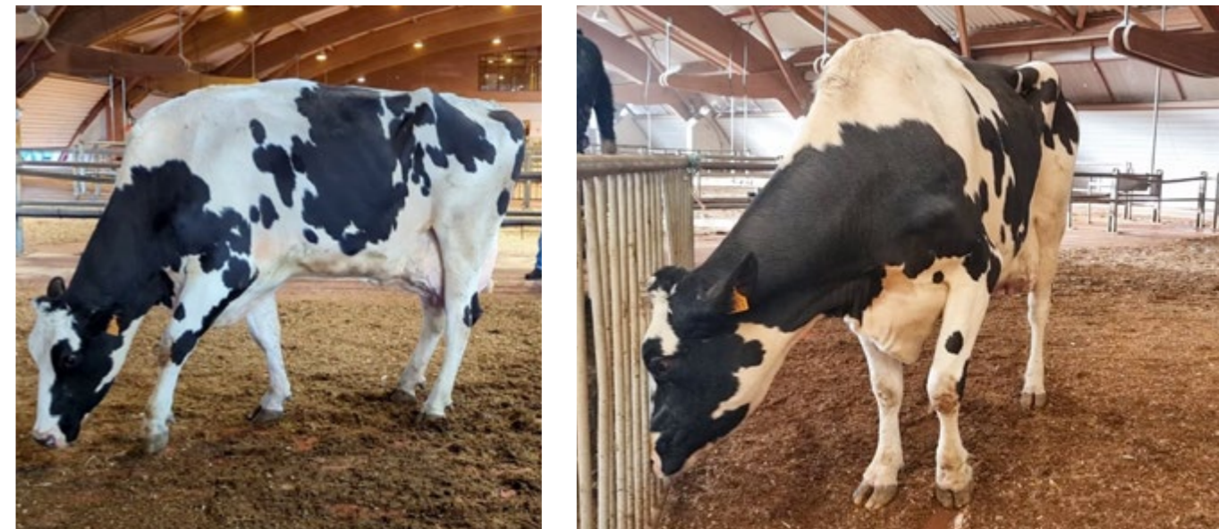
Lilou entlastet ihr linkes Vorderbein. Die Kuh zeigt ein Schmerzgesicht. Sie scheint sich hinlegen zu wollen.

Lilous Körper-Konditions-Index (BSC) wird mit 2,75 33 bewertet. Sie ist schwer lahm. Lilou kann ihr linkes Vorderbein nicht belasten. Sie kann kaum laufen. Ihr Rücken ist gekrümmt. Sie hat Schmerzen. Unser Team beobachtet sie zum ersten Mal um 10:22 Uhr. Lilou wirkt erschöpft, sie versucht sich hinzulegen, aber das dauert sehr lange, sie zögert immer wieder, und der harte Boden erschwert die Situation. Lilou soll zwischen 17:00 Uhr und 17:30 Uhr zu einem nahegelegenen Schlachthof 34 gebracht werden. Der Transporteur weigerte sich jedoch, sie aufgrund ihrer schweren Lahmheit aufzuladen. Schließlich bringt der Besitzer sie zurück zu seinem Hof. Wir informieren die für diesen Betrieb zuständige Veterinärbehörde. Diese führt eine Kontrolle auf dem Hof durch und stellt fest, dass die Kuh eine schwere Lahmheit am linken Vorderbein aufweist, verursacht durch eine exsudative Verletzung. Das Veterinäramt ordnet die tierärztliche und podologische Behandlung für Lilou an. Am 02.01.2024 wurde Lilou schließlich zur Schlachtung verkauft, nachdem ihre Genesung von den Amtstierärzt:innen bestätigt worden war. Im August 2024 trifft unser Team auf den ehemaligen Besitzer von Lilou. Er beschimpft und bedroht unser Team heftig für „das, was ihm wegen Lilou angetan wurde“, da er gezwungen war, sie einen halben Monat lang auf dem Hof zu halten und tierärztlich behandeln zu lassen.